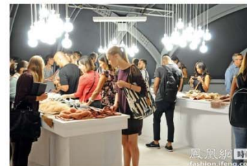
意大利式的可持续发展