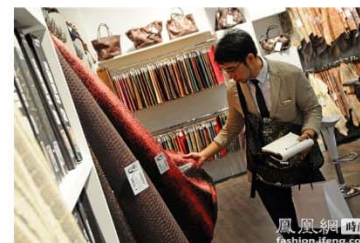
意大利式的可持续发展

近年来，展会取得了显著的成功，其使得更多的皮革厂更多地参与可持续经营，并继续推动意大利的可持续发展。鉴于LIMAPELLE在世界范围内取得的巨大成功，该展会目前正在着手放眼国际市场，为其提供高品质、可持续发展的皮具制品。