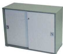
11 armadietto Fly Fly cabinet