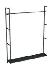
15 barra Hyde "150" "150" Hyde bar