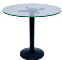
02 tavolo "Mojito" tondo "Mojito" circle table