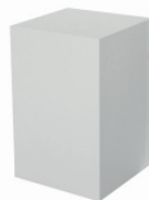
08 cubo alto high cube