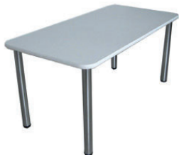
01 tavolo "Cromos" "Cromos" table