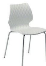
04 sedia "Diamante" "Diamante" chair