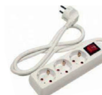
20 Presca Multipla 900W Multipin socket 900W