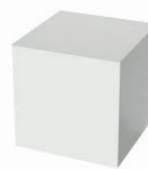
09 cubo basso low cube