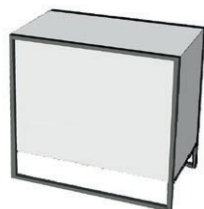
07 banco "Ghost" "Ghost" desk