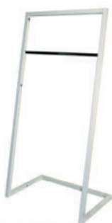
16 barra "L-MAX 100" "100 L-MAX" bar