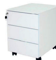
10 cassettiera dresser