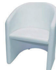
05 poltrona "Manlio" "Manlio" armchair