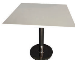
03 tavolo "Bechet" "Bechet" table