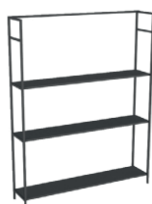
12 * mensole Jekyll "100" "100" Jekyll shelves